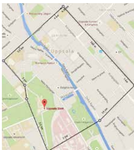
Kaputiei täcker en yta på 1 km 2 . På denna yta skulle nästan hela centrala Uppsala rymmas inklusive Uppsala slott, stadsparken, domkyrkan, centralstationen och flera bostadskvarter.

BOSTÄDER: Området kommer bestå av 2 500 bostadshus med varierad arkitektur. Enligt önskemål från den lokala marknaden byggs hus i tegel med möjlighet till utomhuskök. Husen har 2-4 rum och kök, toalett dusch och egen trädgård.