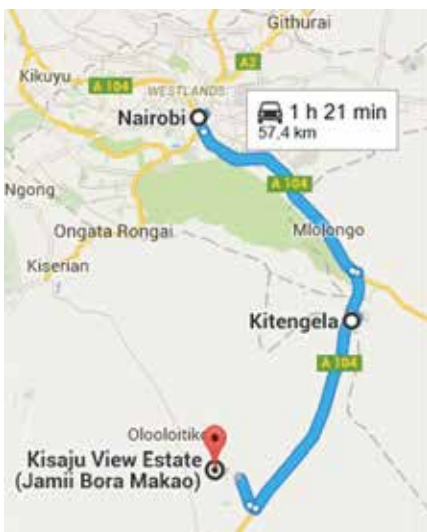
Kaputiei ligger i Kajiado County, 55 km söder om Nairobi som har 3 miljoner invånare.

Aldrig tidigare har privata investerare gått samman för att bygga ett projekt i denna storlek. Att bygga en stad från grunden. En banbrytande satsning som visar att det är möjligt att bygga bostäder till låg kostnad för människor med små inkomster. Projektet har satt avtryck i Kenya och i världen. 2011 tilldelades Kaputiei projektet pris för miljömässig hållbar utveckling av Millennium Development Goal Trust Fund i Kenya för sina utomordentliga insatser mot FNs millenniemål om halverad fattigdomen till år 2015. I samarbete med Jamii Bora Bank erbjuder Kaputiei sina husköpare möjlighet till bostadslån vilket tidigare varit ovanligt, av Kenyas 40 miljoner invånare finns enbart 14 000 bostadslån registrerade. Fler banker har följt efter och hjälper nu fler människor att uppfylla sin dröm om ett eget hem.